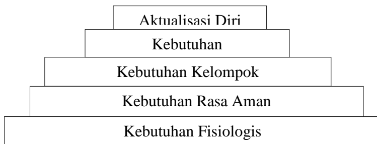
Gambar 2.1. Hierarki. Kebutuhan Maslow

Maslow juga mengatakan kebutuhan-kebutuhan itu berlaku pada setiap manusia dan tersusun menurut hierarki kepentingannya. Hierarki kebutuhan yang dimaksud, dikemukakan dengan gambar berikut :